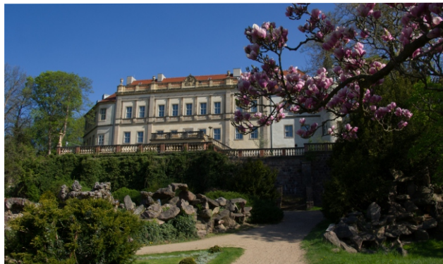
Schloss Wiesenburg mit Magnolienblüte