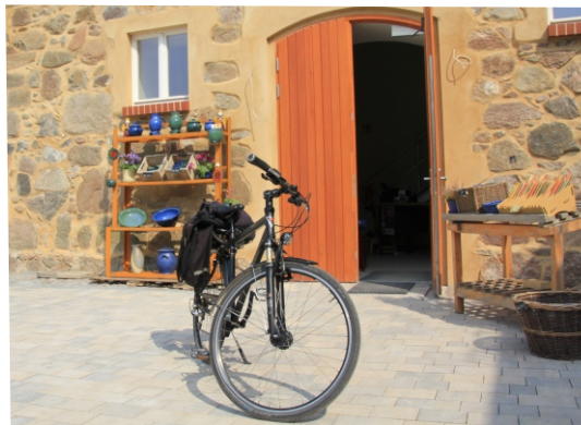
Töpferei Königsblau in Schmerwitz