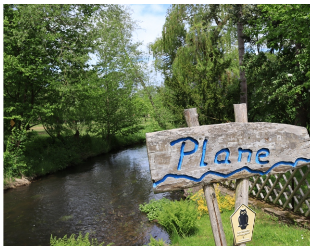
An der Plane mit ihren Forellenhöfen bietet sich manch lauschiges Plätzchen für eine kleine Rast...